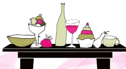
Suite's „Tischlein deck Dich“

Nur auf Vorbestellung für mindestens zwei Personen. Kinder werden mit 1,-€ pro Lebensjahr berechnet. Tickets zum Verschenken im Café erhältlich.